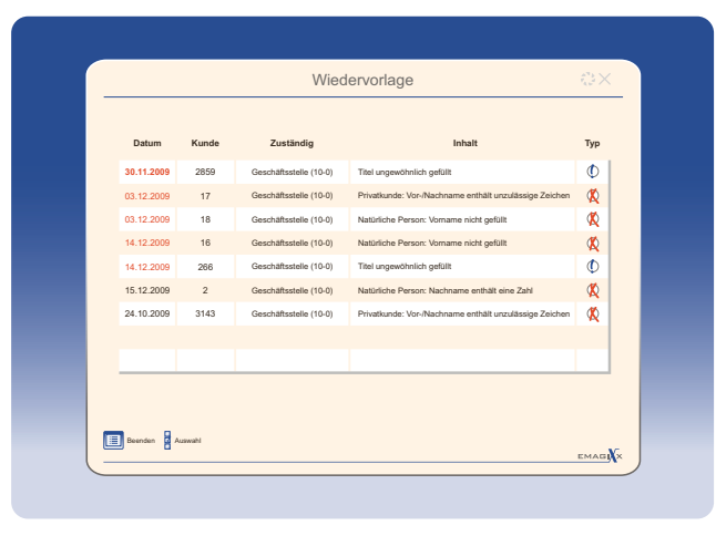
Wiedervorlagen mit enfoxx Progress

Durch die bewusst einfach gehaltene Bedienung lassen sich auch kurze Zeifensinnvoll nutzen. Bei Meldungen, die nicht abschließend bearbeitet werden können, erinnert eine Wiedervorlage daran, die Korrektur termingerecht fortzusetzen.