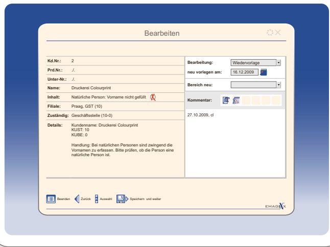
Bearbeitung von Auffälligkeiten mit enfoxx Progress

Das Ergebnis der Bearbeitung wird in enfoxx Progress vermerkt. Verdachtsfälle, die sich nicht bestätigen oder Fehler, die keine Bereinigung zulassen, werden nicht mehr angezeigt. Durch eine automatische Dokumentation bleibt das Bearbeitungsergebnis jedoch nachvollziehbar.